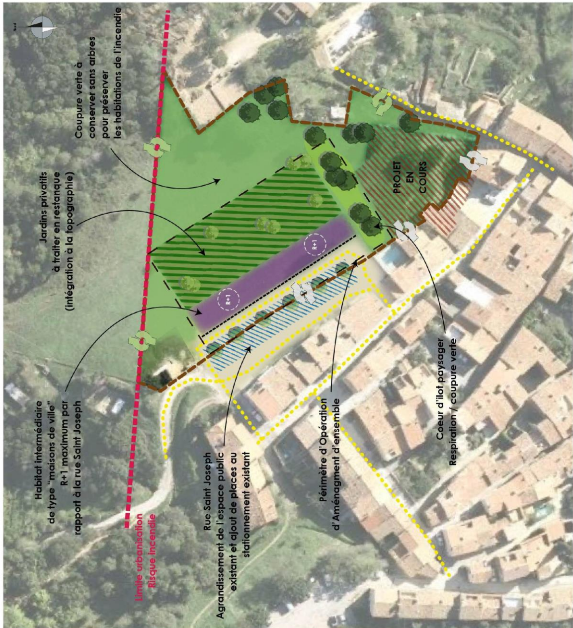
LA GARDE FREINET // OAP SAINT JOSEPH