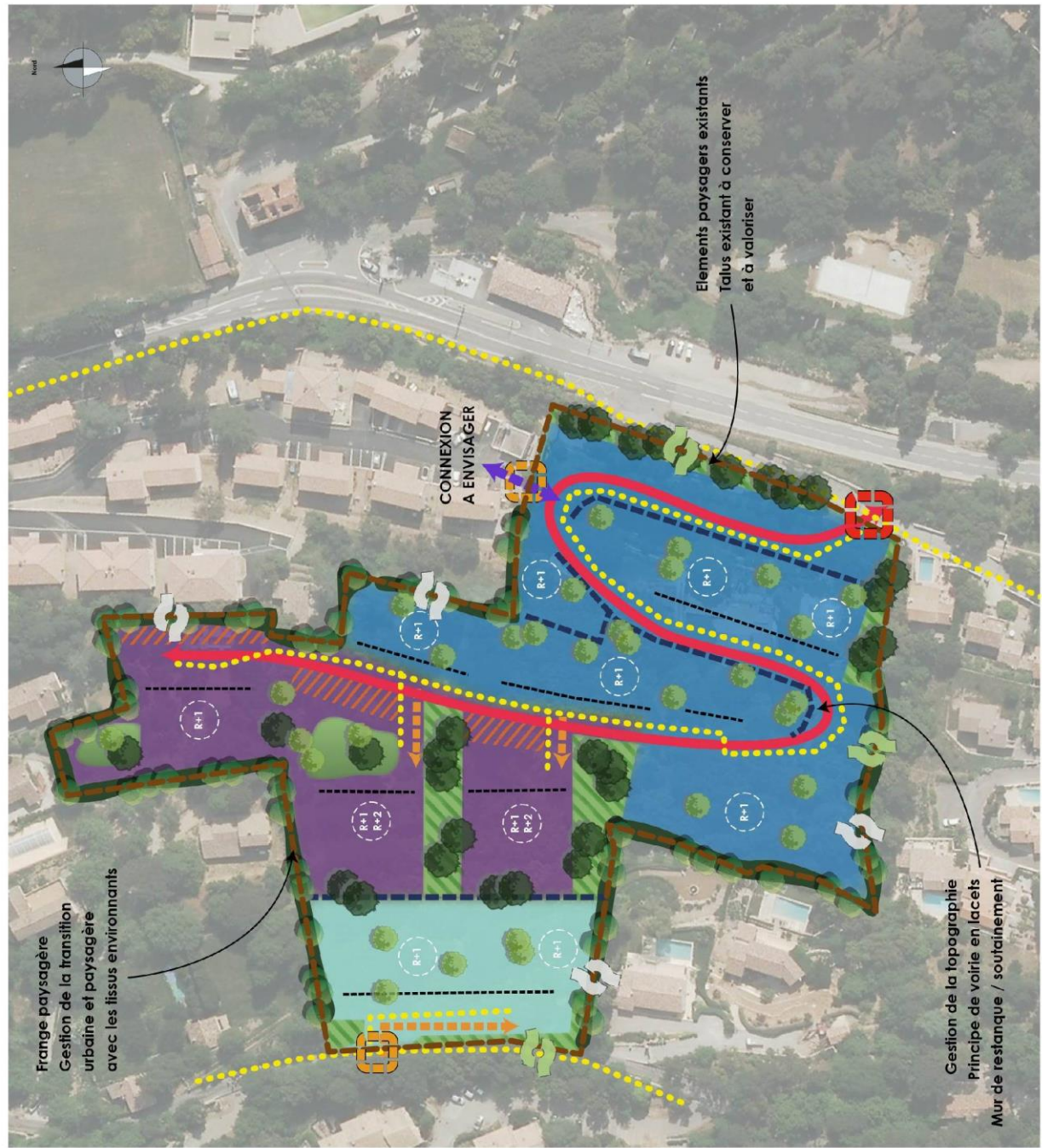
LA GARDE FREINET // OAP SUD VILLAGE